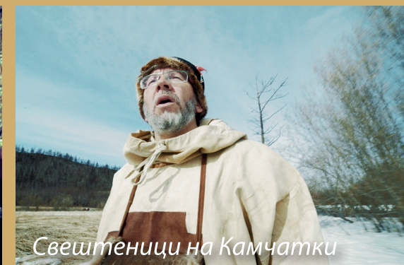
Свештеници на Камчатки