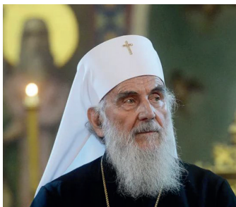
Његова Светост Патријарх српски Иринеј

Потврђујемо пријем Вашег молбеног обраћања у коме изражавате жељу да следеће године у граду Крушевцу оагнизуете Међународни филмски фестивал Православних филмова под називом «Снажни духом».