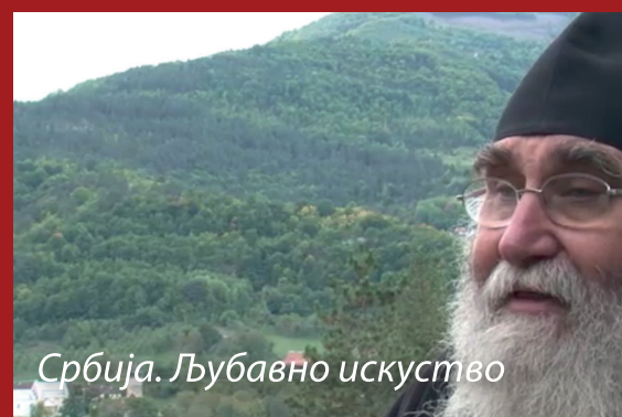
Србија. Љубавно искуство

«СРБИЈА. ЉУБАВНО ИСКУСТВО» Русија (52 мин.)