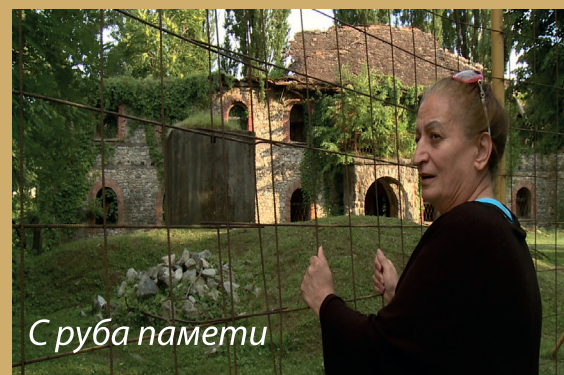
С руба памети