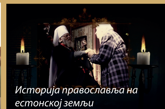
Историја православља на естонској земљи