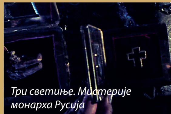
Три светиње. Мистерије монарха Русија

Сви филмови ће бити приказани у Белој сали Културног центра Крушевац (адреса: Топличина 2/2)