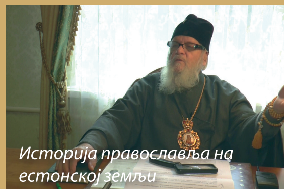
Историја православља на естонској земљи